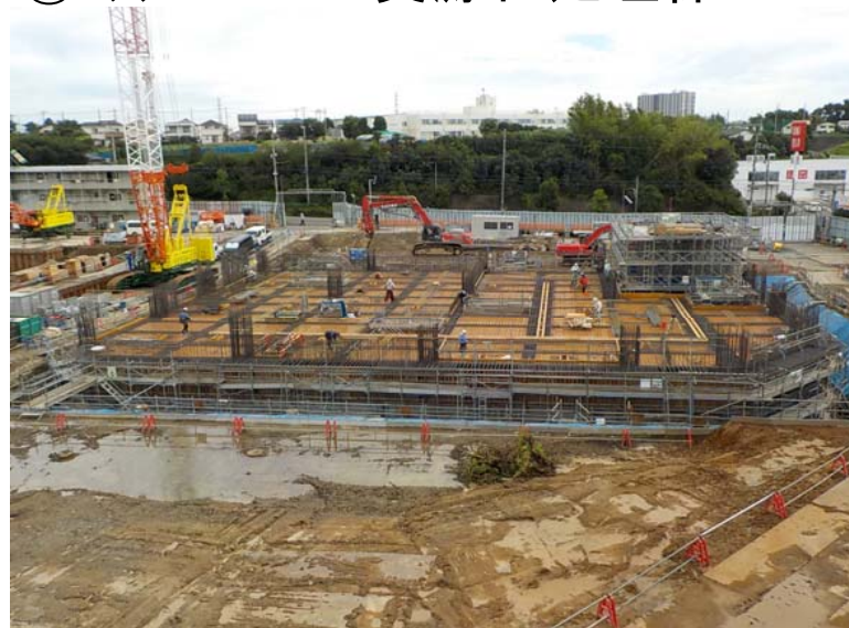
③ミックスペーパー資源化処理棟