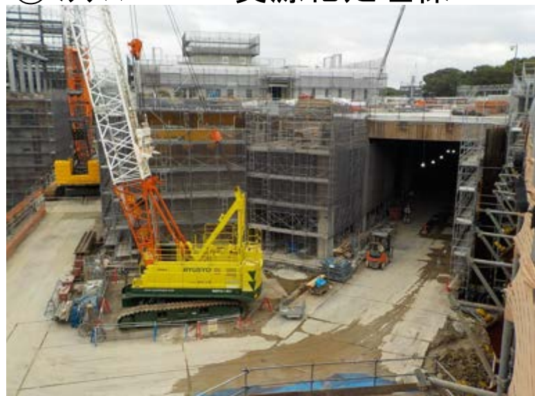
③ミックスペーパー資源化処理棟