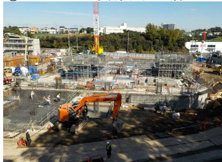
③ミックスペーパー資源化処理棟