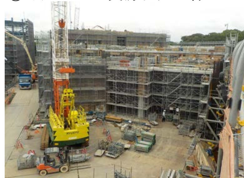
③ミックスパー資源化処理棟