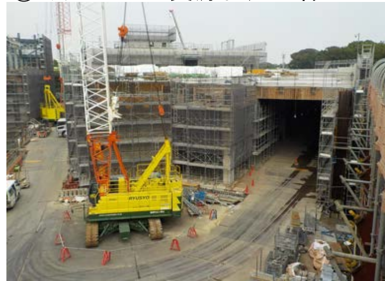
③ミックスペーパー資源化処理棟